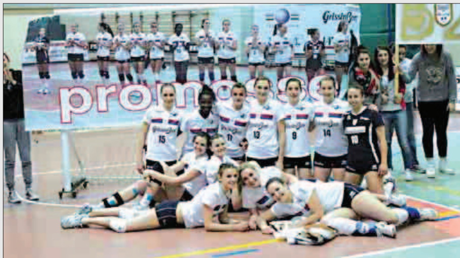
Promozione per la Galileo Giovolley